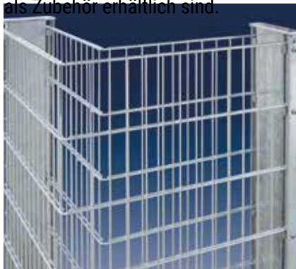
Ecklösung im 90°-Winkel

Stabilität erhält die RANKO Steinmauer durch die feuerverzinkten Doppelstabmatten vom Typ 8/6/8 sowie durch Profilrohrpfähle mit beidseitigen Profilschienen und Alu-Auflageböcken, die vor der Montage einbetoniert werden. Ein „Ausbauchen“ wird durch den Einsatz von Schraubspannern vermieden, die als Zubehör erhältlich sind.